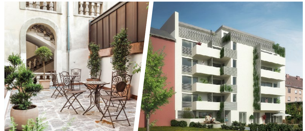
Projekt Graz – Urbanes Wohnen 16 Wohnungen in 3 unterschiedlichen Wohnquartieren: Glamour, Natur und Puristisch