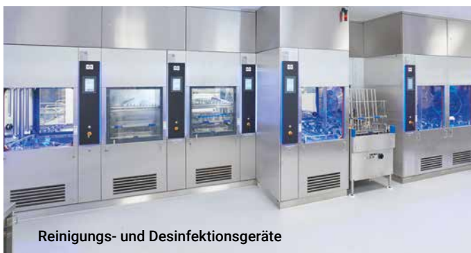
Reinigungs- und Desinfektionsgeräte

Reinigung & Desinfektion | Verpackung & Sterilisation | Mobile AEMP | Transport & Lagerung | Dokumentation | Service & Validierung | Beratung & Ausführung | Schulung von AEMP Personal | Hygieneorientierte Ablaufoptimierung